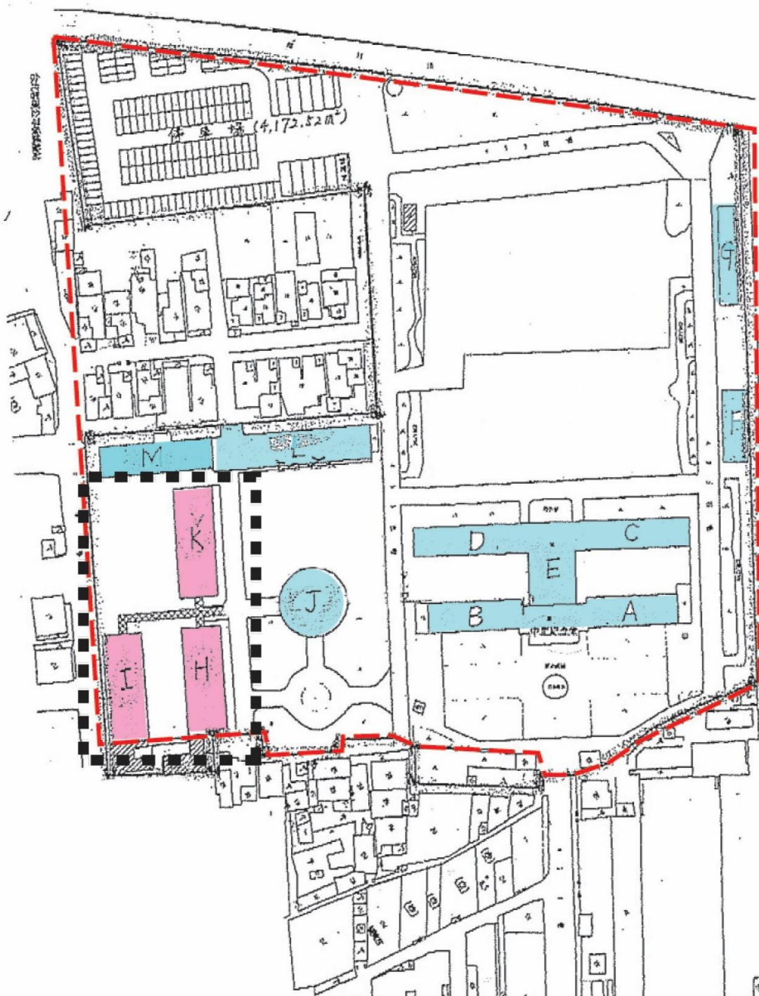
板橋435藝文特區 平面圖